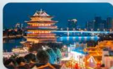
ถนนสามสายสองตรอก