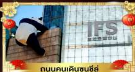
ถนนคนเดินชุนชี่อู๋

เที่ยวอุทยานสวรรค์ระดับ 5A จิวจ้ายโกว "ภูเขาสี่ดรุณี" อุทยานชื่อภูเขานิยมชาน