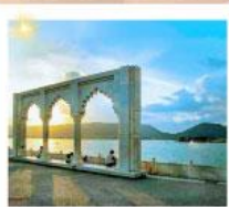
Ana Sagar Lake