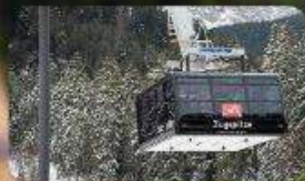
นั่งกระเช้าซูกสปีตซ์