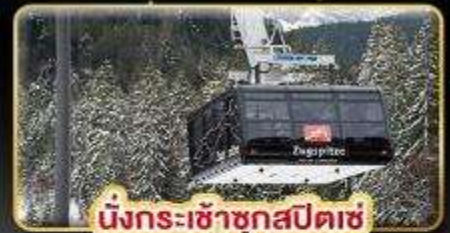
นั่งกระเช้าซุกสปีดเซ่