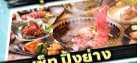
เซ็ก บิงย่าง