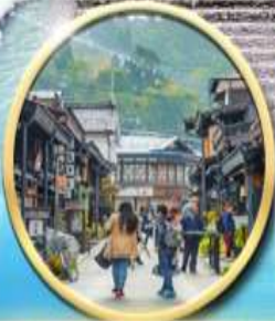
เมืองเก่า ทาคายามา