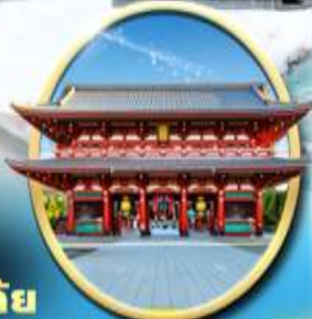
วัด เซ็นโซจิ

ถนนชานานิตะ ซูปบิง ตลาดถนนโยโกะ ตลาดเช้า นิซากาวะ ถนนฮิมะจูกุ สะพานทากาบาชิ