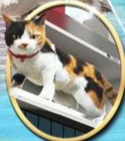
ซูปบิง ชินจุกุ