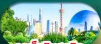
จุดเช็กอินสุดฮิต

เซี่ยงไฮ้ หางโจว ล่องทะเลสาบซีหู ฟรีคีย์