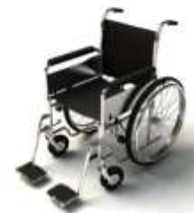
การรับดูแลเป็นพิเศษ

กรณีผู้เดินทางต้องการความช่วยเหลือเป็นพิเศษ อาทิเช่น การใช้วีลแชร์ กรุณาแจ้งบริษัทฯ อย่างน้อย 7 วันก่อนการเดินทาง มิฉะนั้นบริษัทฯ จะไม่สามารถจัดการล่วงหน้าได้ เนื่องจากการขอใช้วีลแชร์ในสนามบินนั้น ต้องมีขั้นตอนในการขอล่วงหน้า และบางสายการบินอาจมีการเรียกเก็บค่าใช้จ่ายทั้งทางสนามบินไทยและในต่างประเทศ ซึ่งผู้เดินทางสามารถสอบถามกับเจ้าหน้าที่ได้โดยตรงก่อนทำการจอง และหากในขณะของท่านมีผู้ต้องการดูแลพิเศษ เช่น ผู้ที่นั่งรถเข็น (Wheelchair), เด็ก, ผู้สูงอายุและผู้ที่มีโรคประจำตัวหรือไม่สะดวกในการเดินทางท่องเที่ยวในระยะเวลาเกินกว่า 4 - 5 ชั่วโมงติดต่อกัน ท่านและครอบครัวต้องให้การดูแลสมาชิกภายในครอบครัวของท่านเอง เนื่องจากการเดินทางเป็นหมู่คณะ หัวหน้าทัวร์มีความจำเป็นต้องดูแลคณะทัวร์ทั้งหมด