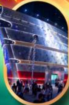
เรือคองฟู