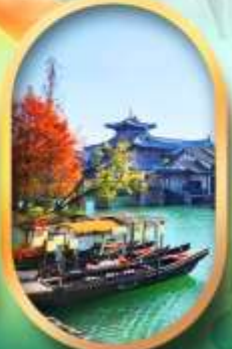
เมืองโบราณผู้หยวน