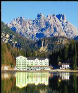
ทะเลสาบบิสุร์น่า