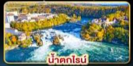
น้ำตกไรน์