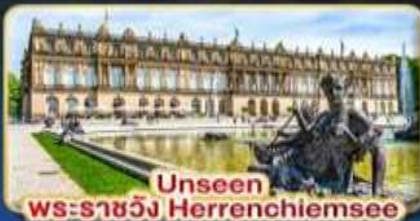
Unseen พระราชวัง Herrenchiemsee

บรรยากาศแสนโรแมนติก เส้นทางแห่งความฝัน พิชิต 2 ยอดเขา 2 ประเทศ TITLIS • ZUGSPITZE