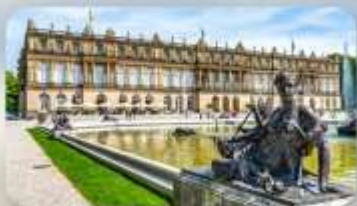
พระราชวัง Herrenchiemsee