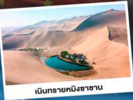
เนินทรายหมิงซาซาน