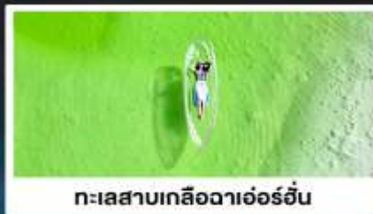
ทะเลสาบเกลือดาเอ๋อร์อัน