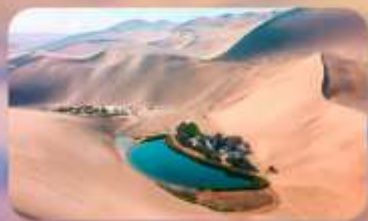
เหมินทรายหมิงซาซาน