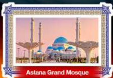
Astana Grand Mosque