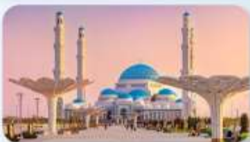
Astana Grand Mosque