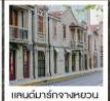
แลนด์มาร์กจางหยวน

เซี่ยงไฮ้ คาสสิก ไนท์ / 3 ดึกใหญ่แห่งเซี่ยงไฮ้ คองเรือหมู่บ้านโบราณจูเจียเจียว / EKA Tianwu / วัดหลงหัว แลนด์มาร์ก จางหยวน / ถนนหวยไห่ / ชมโชว์ ERA ที่โรงละครโด่งดังระดับโลก / ซินเทียนตี้