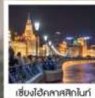
เซี่ยงไฮ้คาสสิกไนท์