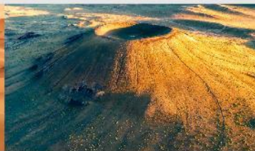
ภูเขาไฟอูลันฮาตา

*ทางบริษัทฯ ขอสงวนสิทธิ์ในการสลับโปรแกรมทัวร์ตามความเหมาะสมขึ้นอยู่กับสถานการณ์หน้างาน โดยคำนึงถึงผลประโยชน์ของลูกค้าเป็นสำคัญ