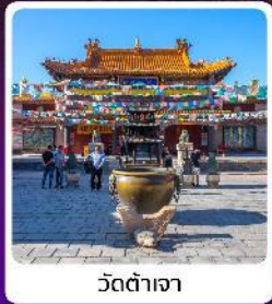
วัดต้าเจา