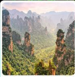
เขาหวดตาร