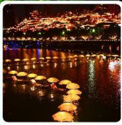
เมืองเซียงอัน