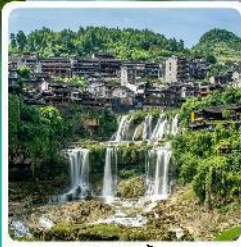
ฟูรงจิ้น

• โฮลท์ อุกยานเทียนเหมินซาน หุบเขาหวดตาร เมืองโบราณเซียงอัน หมู่บ้านโบราณฟูรงจิ้น ภูเขาโรซ่าอู่จี้โต อุกยานซือจ้อกวนด่านสิงโต