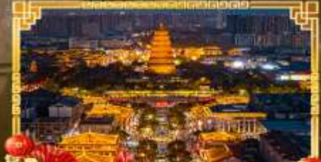
ถนนคนเดินราชวงศ์ถัง