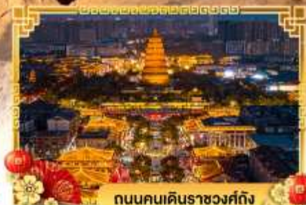
ถนนคนเดินราชวงศ์ถัง

เดินทางโดย: สายการบินสปริงส์แอร์ไลน์ (9C)