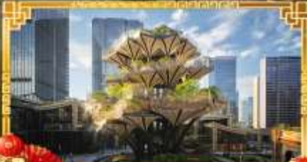
XIAN TREE&MIXC MALL