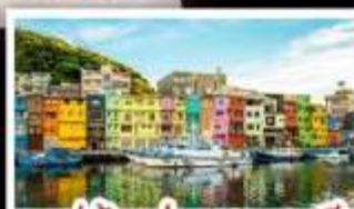
หมู่บ้านประมงหลากสี