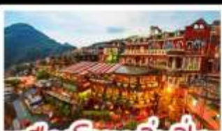
เมืองโบราณจิวเฟิ่น

ฟาร์มแกะซิงจิง - ทะเลสาบสวี่นจินตรา จิวเฟิ่น - หมู่บ้านประมงหลากสี - ไทเป 101 หมู่บ้านสายรุ้ง - ตลาดล่าหูก & ซีเหมินติง ปลาประ-ธานธิบดี - เขียวหลงเปา