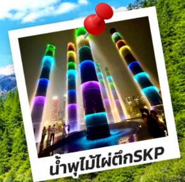
น้ำพุไม้ไฟตึกSKP

อุทยานปีเพิงโกว อุทยานจิวจ้ายโกว 6วัน 5คืน