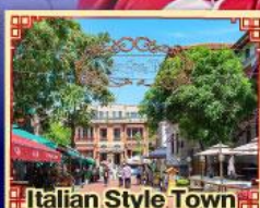
Italian Style Town