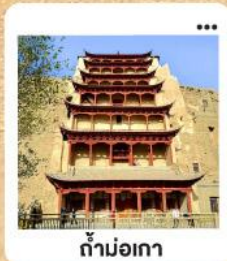
ต้าม่อเกา