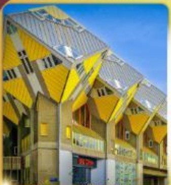
บ้านลูกดำ โลกคู่มูส

“ล่องเรือหลังคากระจก” ชมกรุงอัมสเตอร์ดัม