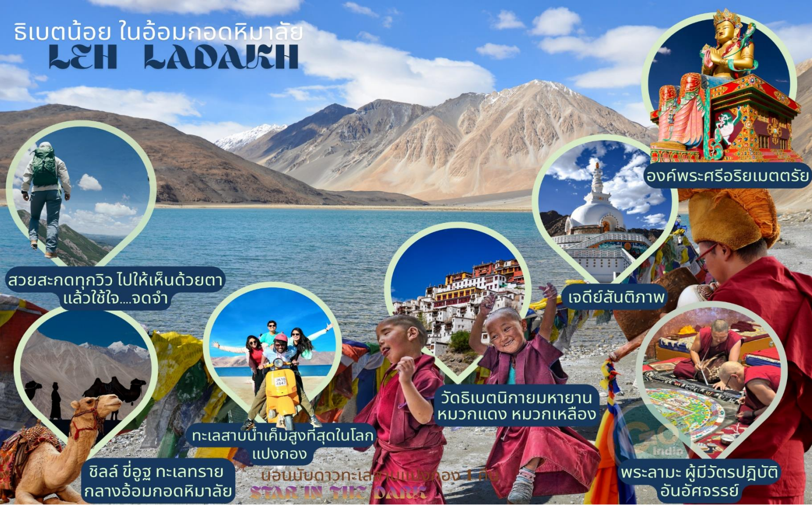
องค์พระศรีอริยเมตตรีย์