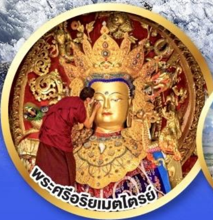
พระศรีอริยเมตไตรย์