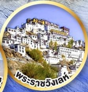
พระราชวังเลห์