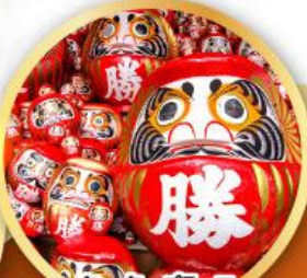
วัดคิตสึโองิ (วัดदारุมะ)

ชมความงามของกำแพงหิมะ เส้นทางสายอัลไพน์ ทากายามา (JAPAN ALPS SNOW WALL)