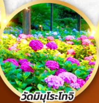
วัดมิบุโระโทจิ