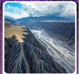
แกรนด์แคนยอนคู่ซานจื่อ