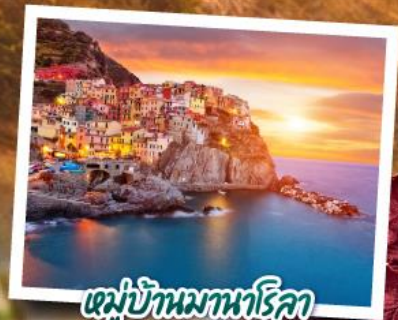
หมู่บ้านมาทสึยามา