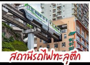
สถานีรถไฟทะเลสาบ

ชิง - อุโมงค์ - หงหยาดัง อุทยานเขานางฟ้าลงชิง สถานีรถไฟทะเลสาบ หมู่ฟ้าสามสะพานสวรรค์