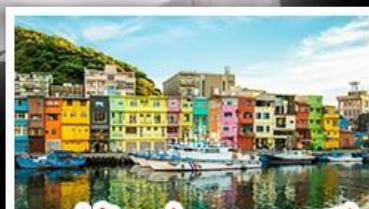
หมู่บ้านประมงเหลากสี