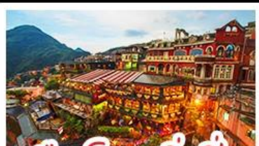
เมืองโบราณจีวเฟิน

เที่ยวธรรมชาติระดับโลก เอเชีย ทะเลสาบสุริยันจันทรา - เมืองดงครบ ไทเป จีวเฟิน - ซีเหมินติง