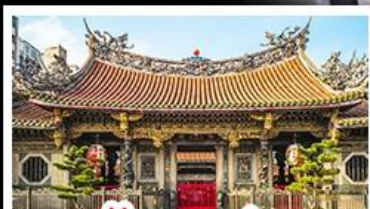
วัดเจหลงชาน