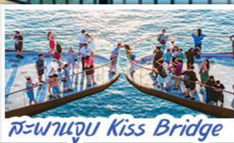
สะพานจูบ Kiss Bridge