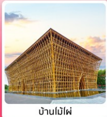
บ้านไม้ไผ่

ไอโอล์ก เที่ยวครบ สวนน้ำ Aquatopia & สวนสนุก Vin Wonder เวนิสแห่งเวียดนาม Grand World Phu Quoc แลนด์มาร์คสุดโรแมนติก