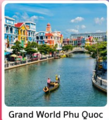
Grand World Phu Quoc