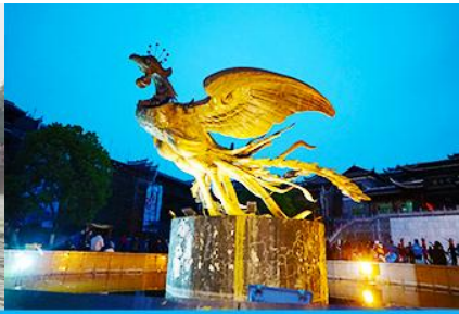
จัตุรัสหงส์