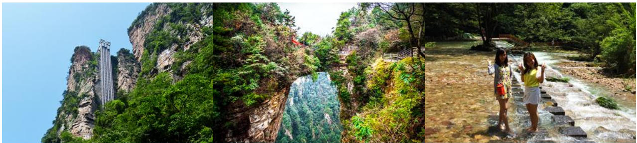
ลิฟท์แก้วไปหลง

หลังอาหารนำท่านเดินทางสู่ อุทยานแห่งชาติจางเจียเจี้ย 张家界森林公园 นำท่านโดยสารรถบัสของเขตอุทยานไปยัง สถานีลิฟท์แก้วไปหลง 百龙天梯 ให้ท่านโดยสารลิฟท์แก้วขึ้นสู่จุดชมวิวในเขตอุทยาน หยวนเจียเจี้ย 袁家界 จุดชมวิวยอดนิยม บนเขาอวตาร ลิฟท์แก้วไปหลง เป็นลิฟท์แก้วชมวิวแบบสองชั้นที่สร้างขึ้นเลียนหน้าผาแนวดิ่งที่มีความสูงราว 325 เมตร เป็น ลิฟท์แก้วชมวิวกลางแจ้งความเร็วสูง ขนาดใหญ่ที่ทำลายสถิติกินเนสบุ๊ค.....ท่านจะตื่นตาตื่นใจกับทัศนียภาพบนเขาอวตาร บนความสูงถึง 1,250 เมตรเหนือระดับน้ำทะเล อาทิ ยอดเขาฮาหลิวยา 哈利路亚山 ภูเขาลอยฟ้าโด่งดังที่เป็นฉากถ่ายทำภาพยนตร์เรื่องอวตาร