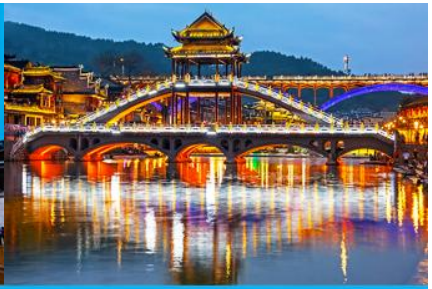
สะพานหงเจียว