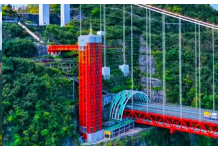
ลิฟท์แก้วอุทยานไร่จ้าย