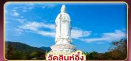
วัดลินทอิ่ง