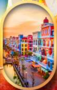
เวนิสแห่งเวียดนาม