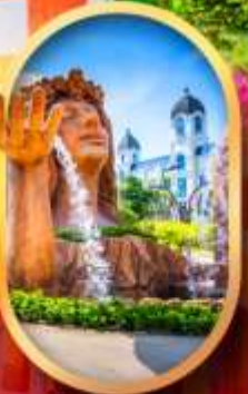
น้ำตกเทพพิทักษ์