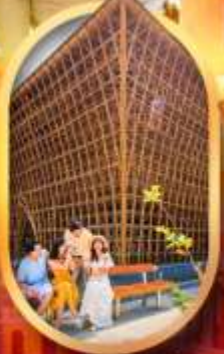
อาคารไม้ไผ่