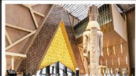
พิพิธภัณฑ์แกรนด์อียิปต์(GEM)

อารยธรรมลุ่มแม่น้ำไนล์ - พีระมิด - อเล็กซานเดรีย - เมมฟิส - ไคโร - โรงแรมระดับ 4 ดาว รวมค่าวีซ่า ครอบคลุมเอกสาร - อาหารครบทุกมื้อ