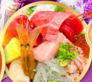
ตลาดปลาซิมิสึ คาชิโนะอิจิ