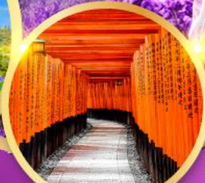
ศาลเจ้าฟุชิมิอินาริ