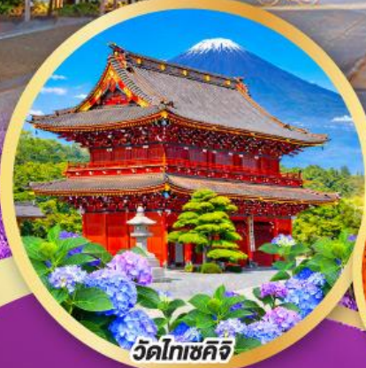
วัดโทเซคิจิ