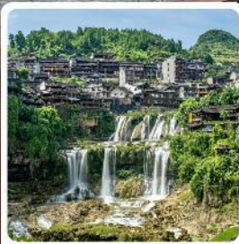
ฝูหลงเจิน