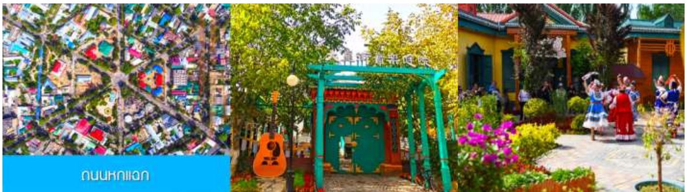
ถนนหนกดอก

จากนั้นนำท่านเดินทางสู่ เมืองอิหนิง 伊宁 (ระยะทาง 200 กม. ใช้เวลาเดินทางราว 3 ชั่วโมง)