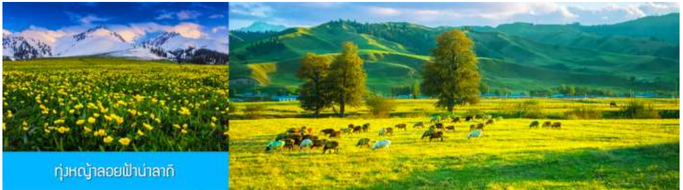
ทุ่งหญ้าลวยฟ้านาลาถิ

พักที่ WAN SEN HOTEL ระดับ 4 ดาวท้องถิ่นในตำบลนาลาถิ