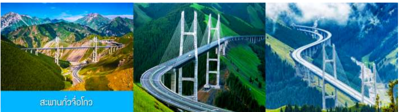
สะพานกั๋วจื่อโกว

หลังอาหารนำท่านเดินทางโดยรถบัสสู่ ตำบลนำลาตี 那拉提 (ระยะทาง 300 กม. ใช้เวลาเดินทางราว 4 ชั่วโมง)