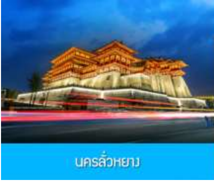
นครลั่วหยาง