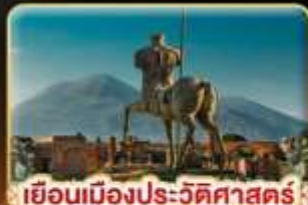
เยือนเมืองประวัติศาสตร์ ปอมเปอี