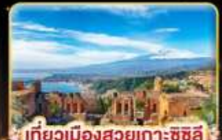
เที่ยวเมืองสวยเกาะซิซิลี Taormina