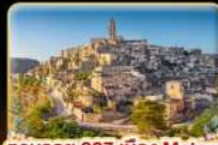
ตามรอย 007 เมือง Matera