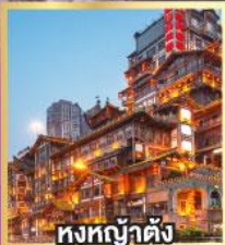
หงษ์ป่าตั้ง