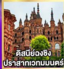
คิสนียองซิง ปราสาทเวทมนตร์