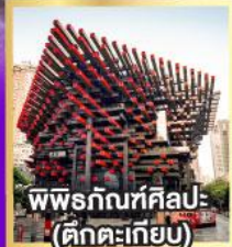
พิพิธภัณฑ์ศิลปะ (ตึกตะเกียบ)