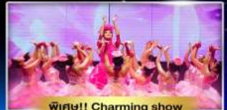
พิเศษ!! Charming show