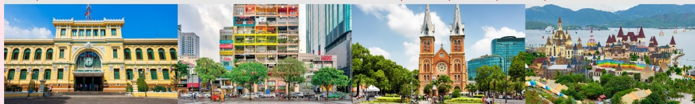
ไพรบ์นีย์กลางโฮจิมินห์