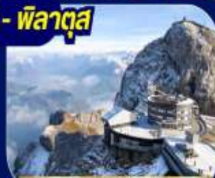
ยอดเวาพิลาทุส

นั่งรถไฟ Bernian Express เส้นทางรถไฟสายมรดกโลก