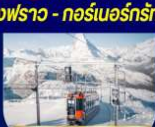
กอร์เนอร์กรัท