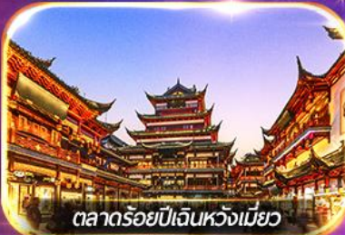
ตลาดร้อยปีเงินหวงเหมียว