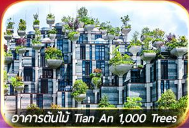
อาคารต้นไม้ Tian An 1,000 Trees