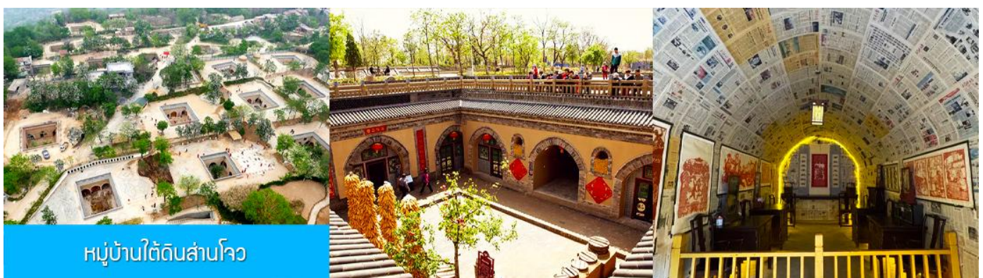
หมู่บ้านใต้ดินสามโจว

หลังอาหารนำท่านเดินทางสู่ เมืองซานเหมินเกีย 三门峡 (ระยะทาง 149 กม ใช้เวลาเดินทางราว 2 ชั่วโมง)