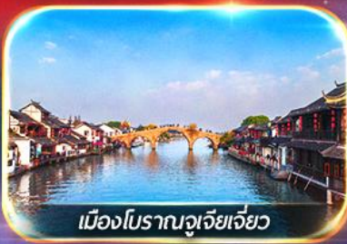
เมืองโบราณจูเจียเจี๋ย