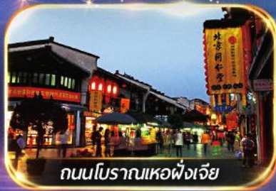
ถนนโบราณเหอผิงเจี๋ย

เช็คอินมุมฮิตใน TIKTOK ณ หาดไว่ทาน เตอะบันด์ + หอไข่มุก อิสระช้อปปิ้งย่านดัง หรือ เลือกซื้อ OPTION SHANGHAI DISNEYLAND