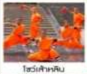
โชว์เจ้าหลิน