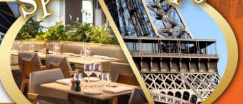
รับประทานอาหารกลางวัน บนหอไอเฟล

ไฮไลท์ในโปรแกรม • สะพานไมซ์าเปล ลูเซิร์น