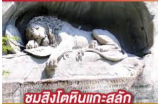
ชมสิงโตหินแกะสลัก