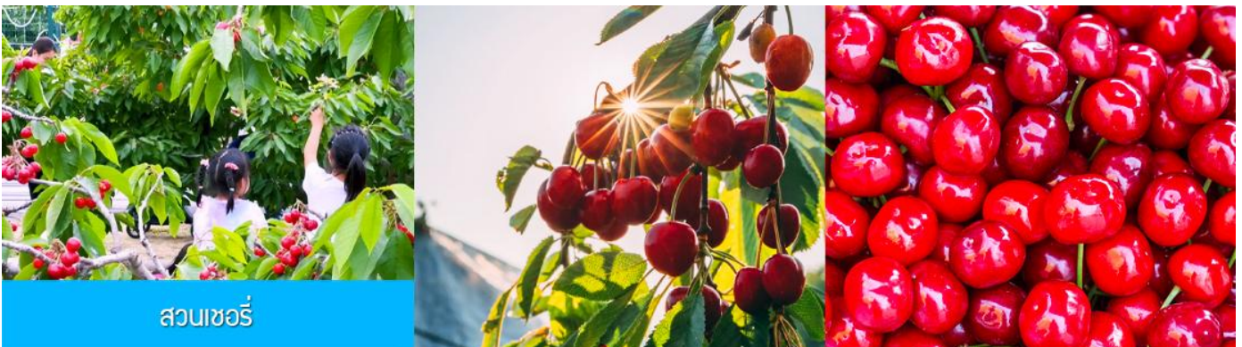
สวนเชอร์รี่

นำท่านสู่ สวนเชอร์รี่ 樱桃园现摘樱桃 ให้ท่านสัมผัสประสบการณ์สุดชิล ด้วยการเด็ดเชอร์รี่สดจากต้นภายในสวนเชอร์รี่ (เชอร์รี่จะของเมืองนี้จะเริ่มสุกและเก็บได้ในช่วงปลายเดือนพฤษภาคม - มิถุนายนของทุกปี ในกรณีที่ผลเชอร์รี่น้อยหรือหมดเร็วกว่าปกติ ทางทัวร์ขอสงวนสิทธิ์ในการจัดโปรแกรมอื่นแทนการเด็ดเชอร์รี่)