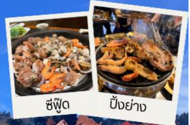
ซิว๊ต ปั้งย่าง