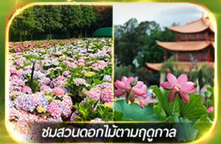
ชมสวนดอกไม้ตามฤดูกาล

นั่งกระเช้ากุเขาสหะเจี้ยวจื่อ ชมน้ำตกสุดอลังการสวนน้ำตกคุนหมิง ช้อปปิ้งถนนคนเดินหนานผิงเจี๋ย, ชมดอกไม้ตามฤดูกาล