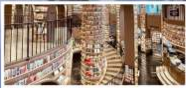
ร้านหนังสือจตุเก๋