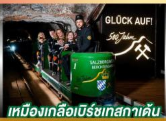
เหมืองเกลือเบิร์ชเทสกาเดิน