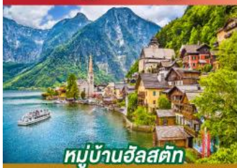
หมู่บ้านอัลสตัด