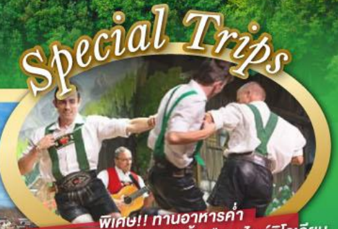
พิเศษ!! ทานอาหารค่ำ พร้อมชมการแสดงดนตรีพื้นเมืองสไตล์ทีโรเลียน และเยือนเมืองอูเทรคต์ สีสันใหม่เนเธอร์แลนด์