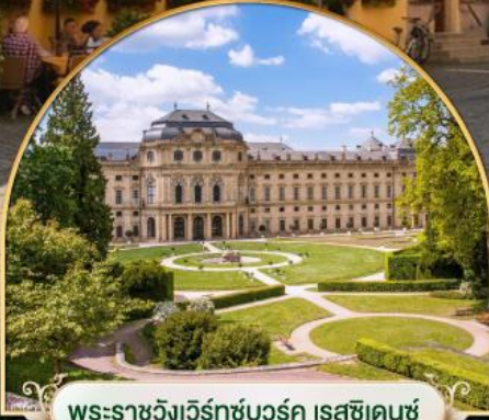
พระราชวังแวร์ซายส์ฝรั่งเศส